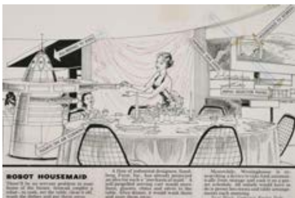
Arthur Radebaugh. Closer Than We Think! El robot del hogar , 1959 ©Tribune Content Agency, LLC. Todos los derechos reservados

Casi a la par que las preocupaciones sobre la organización urbana, durante el siglo XIX comienzan a aparecer intentos por imaginar cómo pueden llegar a cambiar nuestra vida cotidiana los avances científicos y tecnológicos de la época. ¿Dónde viviremos en el futuro? ¿Qué comeremos? ¿Cómo aprenderemos y trabajaremos? ¿Cómo nos comunicaremos? Muchas de estas imágenes tuvieron una circulación mucho mayor que otras especulaciones sobre el futuro debido a que se materializaron en ilustraciones, fotografías y, más tarde, películas para los medios y la publicidad. Es quizá en la segunda mitad del siglo XX cuando