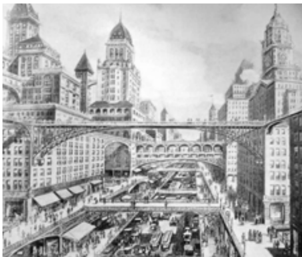
Harvey Wiley Corbett. New York Tribune , 16 de enero de 1910

Probablemente no exista otro espacio como la ciudad misma para demostrar más claramente esa retroalimentación que ha habido entre las imágenes del futuro y el cambio material que las hace posibles. Las visiones creadas por Fritz Lang, Horst von Harbou y Hugh Ferriss, entre otros, se convierten de manera muy real en los planos para construir una modernidad industrial y urbana que funciona como un motor para la Gran Imaginación.