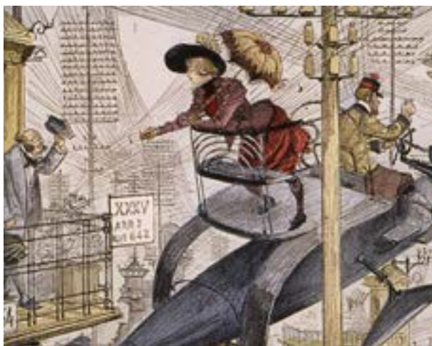
Albert Robida. La vida eléctrica. Un barrio enmarañado , 1893

Es necesario esperar hasta el siglo XVIII para el surgimiento de los primeros relatos propiamente futuristas: Memorias del siglo XX de Samuel Madden (1733) y, particularmente, El año 2440 de Louis-Sébastien Mercier (1771). La ucronía imaginada por este último inició un nuevo paradigma al imaginar un tiempo futuro conectado cronológicamente y, lo que es más importante, causalmente, con su presente. Así, las ucronías del siglo XVIII abrieron las puertas a 250 años de explosión imaginativa orientada hacia el futuro. ¿Es casualidad que esta explosión se desatara precisamente cuando se acelera el crecimiento de las ciudades, se dispara la movilidad o eclosionan las tecnologías de la comunicación? ¿La imaginación futurista florece gracias a un contexto de progreso material o es precisamente el estallido de una fantasía creativa lo que anima y guía el sinfín de innovaciones que aparecen en este momento?