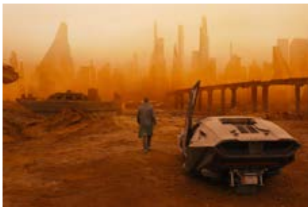
Denis Villeneuve. Blade Runner 2049 , 2017

Si la ficción futurista nace con las ucronías del siglo XVIII proyectando los sueños de la modernidad en un tiempo futuro, podríamos decir que alcanza su clímax durante el siglo XX conforme las pesadillas de la modernidad comienzan a tomar un lugar cada vez más protagonista en la Gran Imaginación. Primero la literatura y después el cine distópico (así como otros medios de expresión) se han usado para advertirle a la humanidad sobre los riesgos de una racionalización extrema que deviene en control social, las consecuencias inesperadas del cambio tecnológico, el impacto ecológico de nuestras formas de vida y la posibilidad de una guerra final. Nos encontramos actualmente en una encrucijada