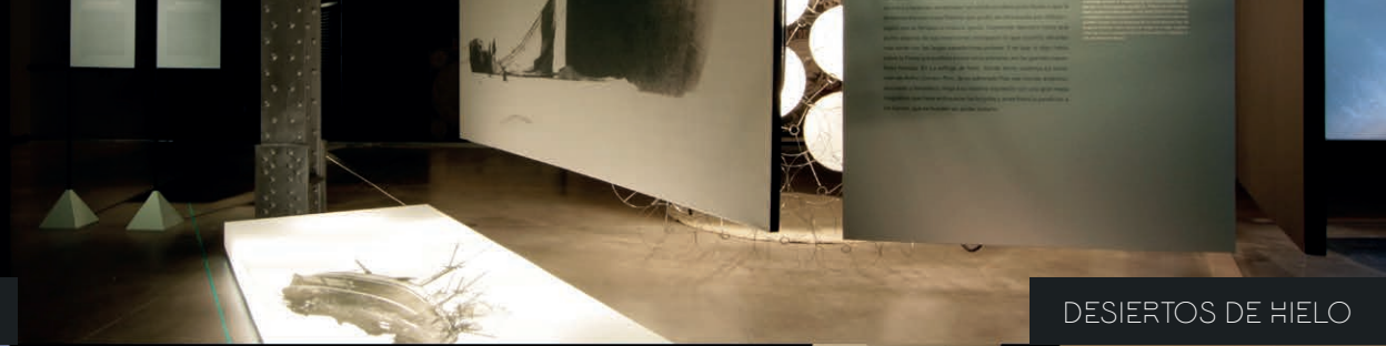
DESIERTOS DE HIELO