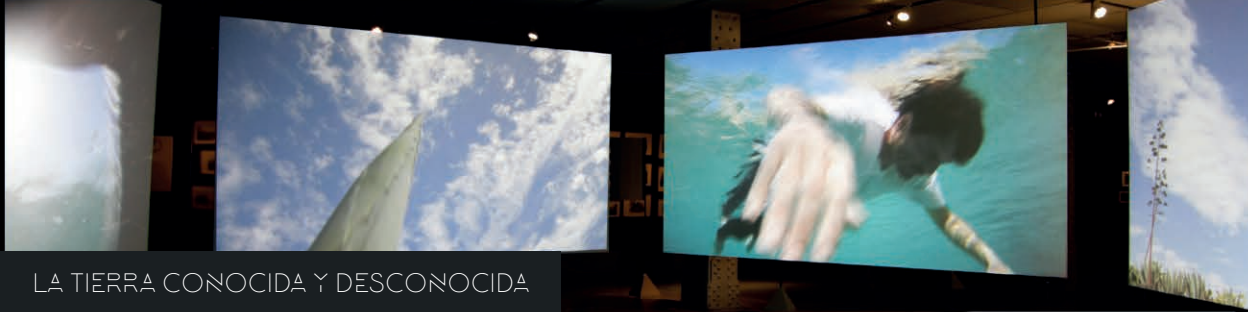
LA TIERRA CONOCIDA Y DESCONOCIDA