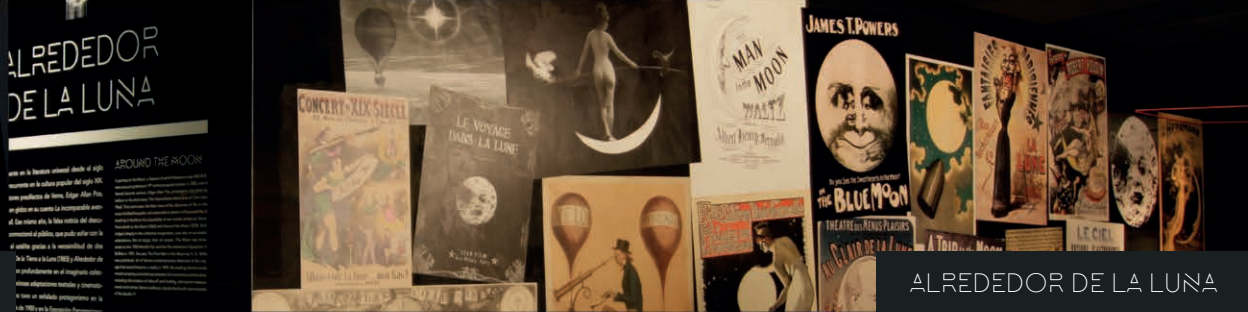
ALREDEDOR DE LA LUNA