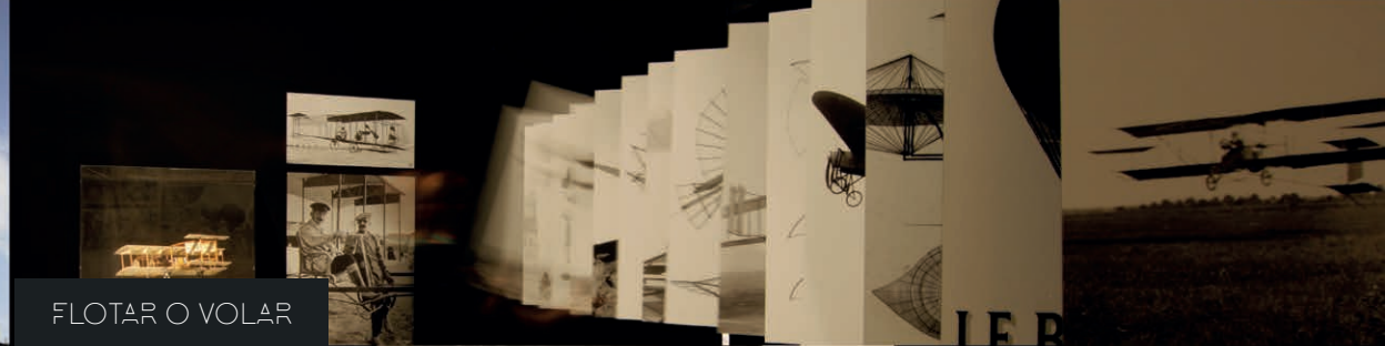
FLOTAR O VOLAR