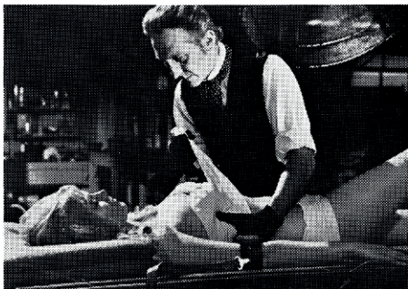
PETER CUSHING creates SUSAN DENBERG in 20th Century Fox release "FRANKENSTEIN CREATED WOMAN" • color by deluxe