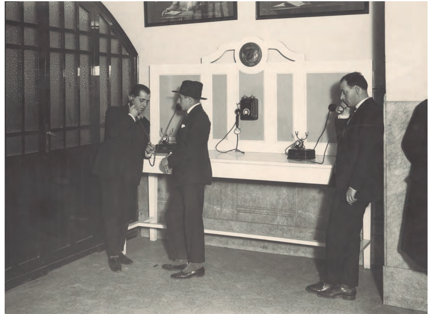
Anónimo. Mesa de instrucción instalada en la central de Alcalá I , s.f.