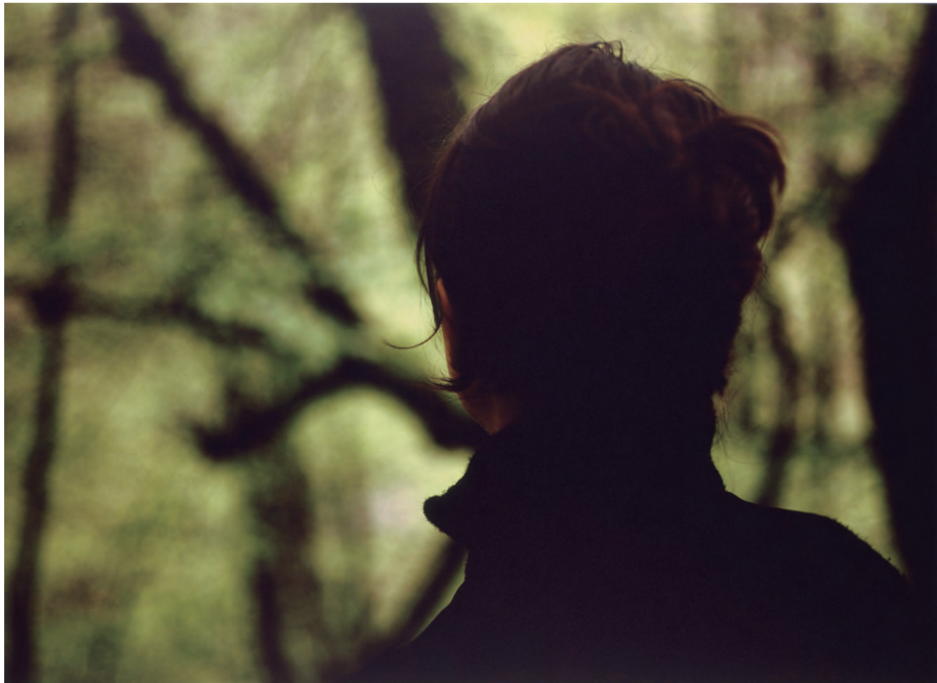
▲ Willie Doherty, Unknown Female Subject II , 2003