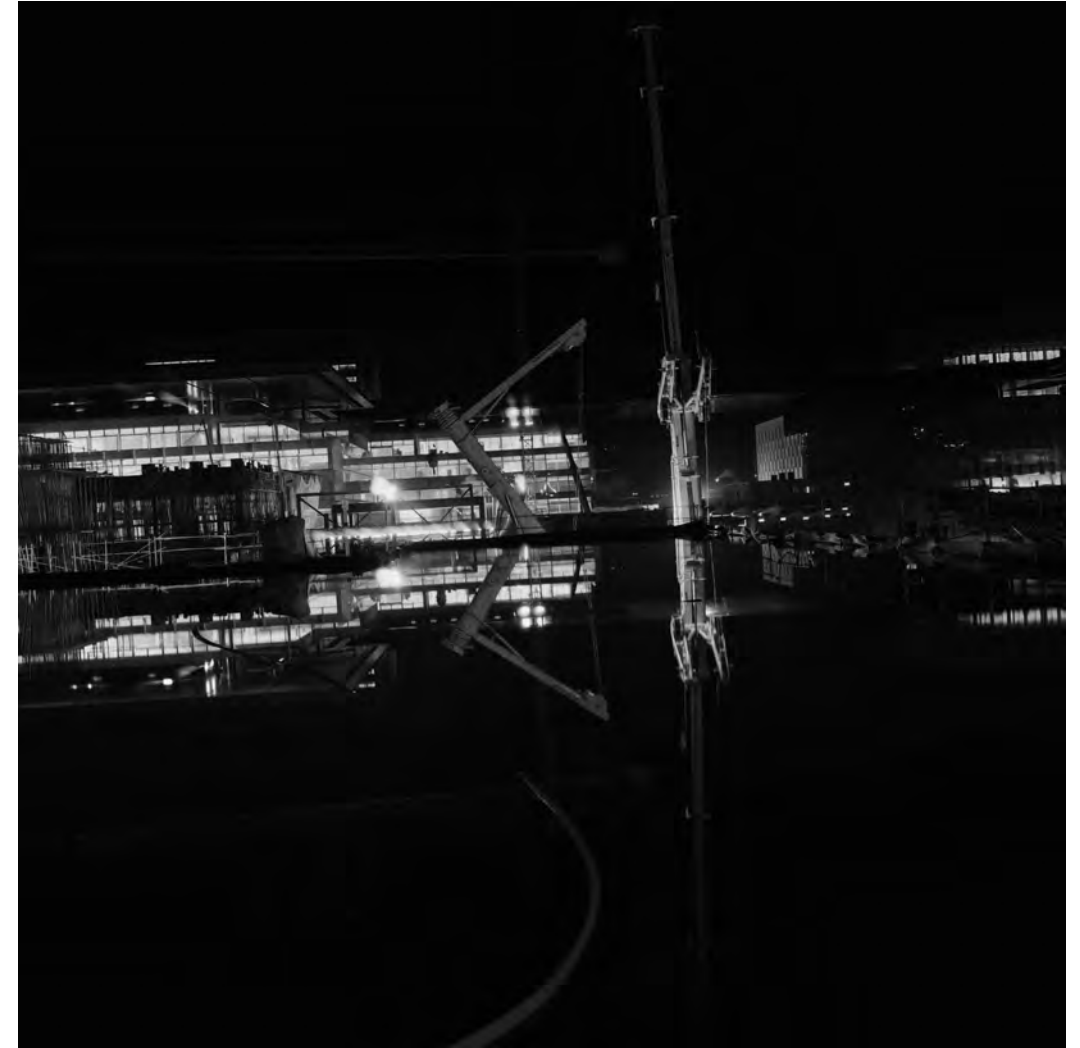
Manel Esclusa. Entre calma y silencio, 2006