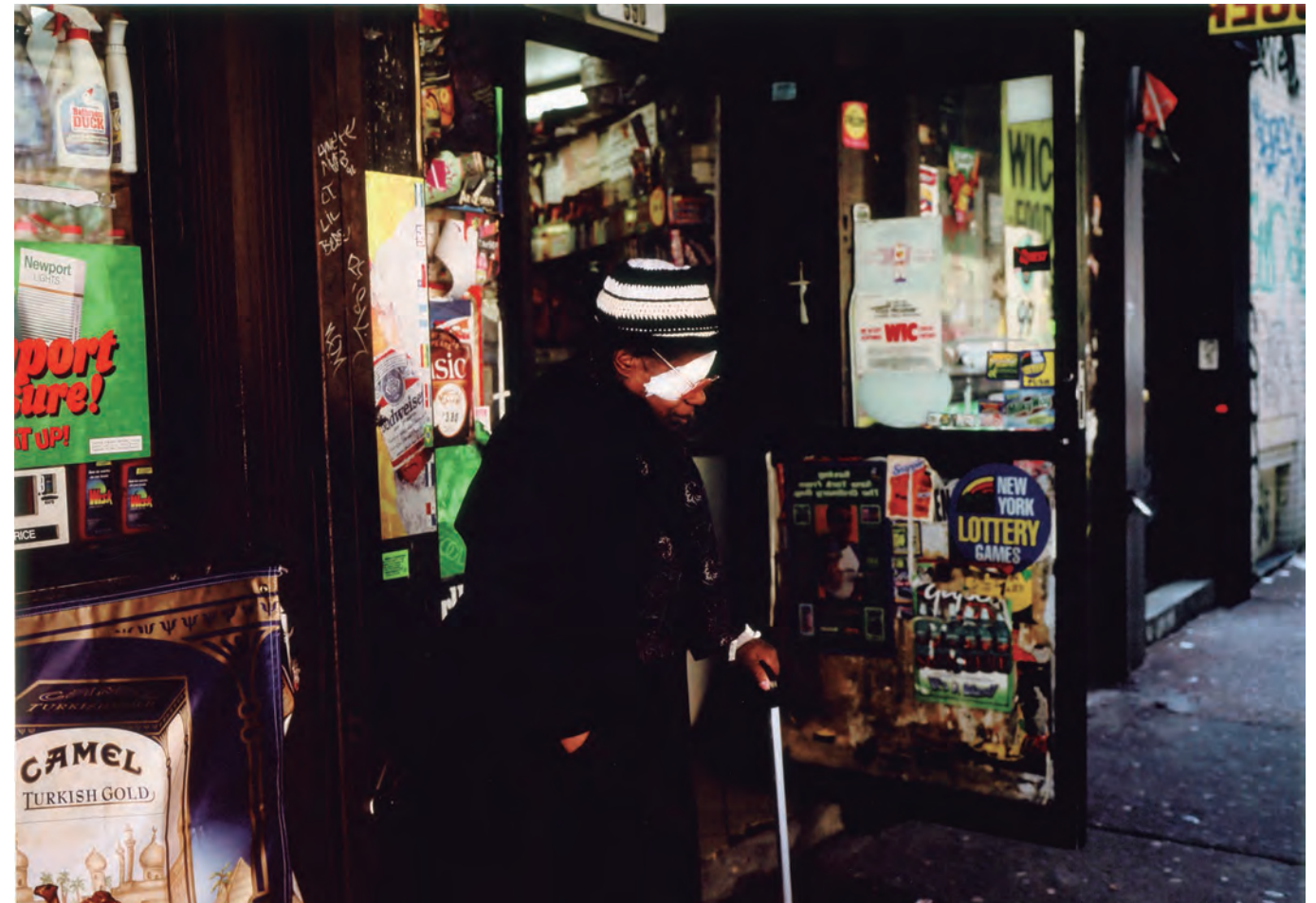
Paul Graham. Untitled #45, Blinden woman, New York, 1998

In summary, I wish you time and an unhurried gaze that goes beyond, indeed, the surface of the stadium of these speculative images. May they embrace your enjoyment and stimulate your pleasure in all these hidden stories imbued with sensory awareness.