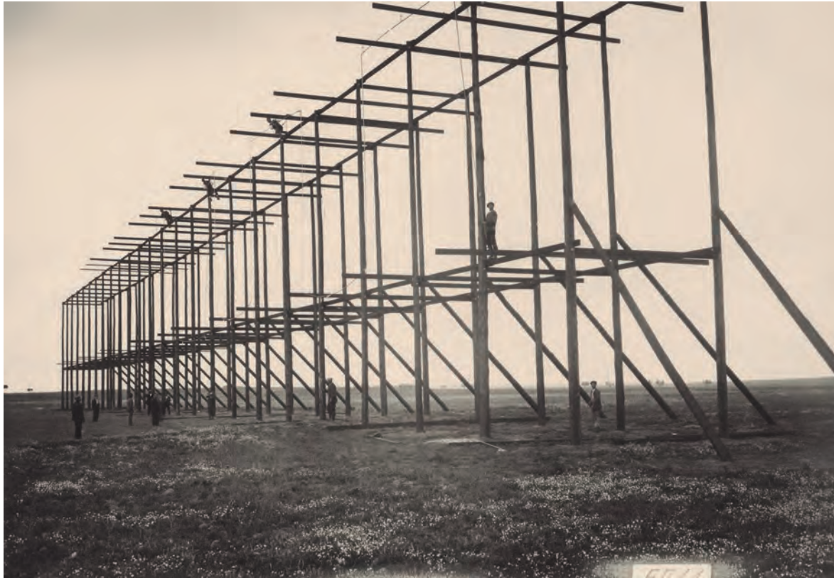
Anónimo. Terminando una antena en la estación de Griñón, s.f.

*Archivo Histórico Fotográfico de Telefónica