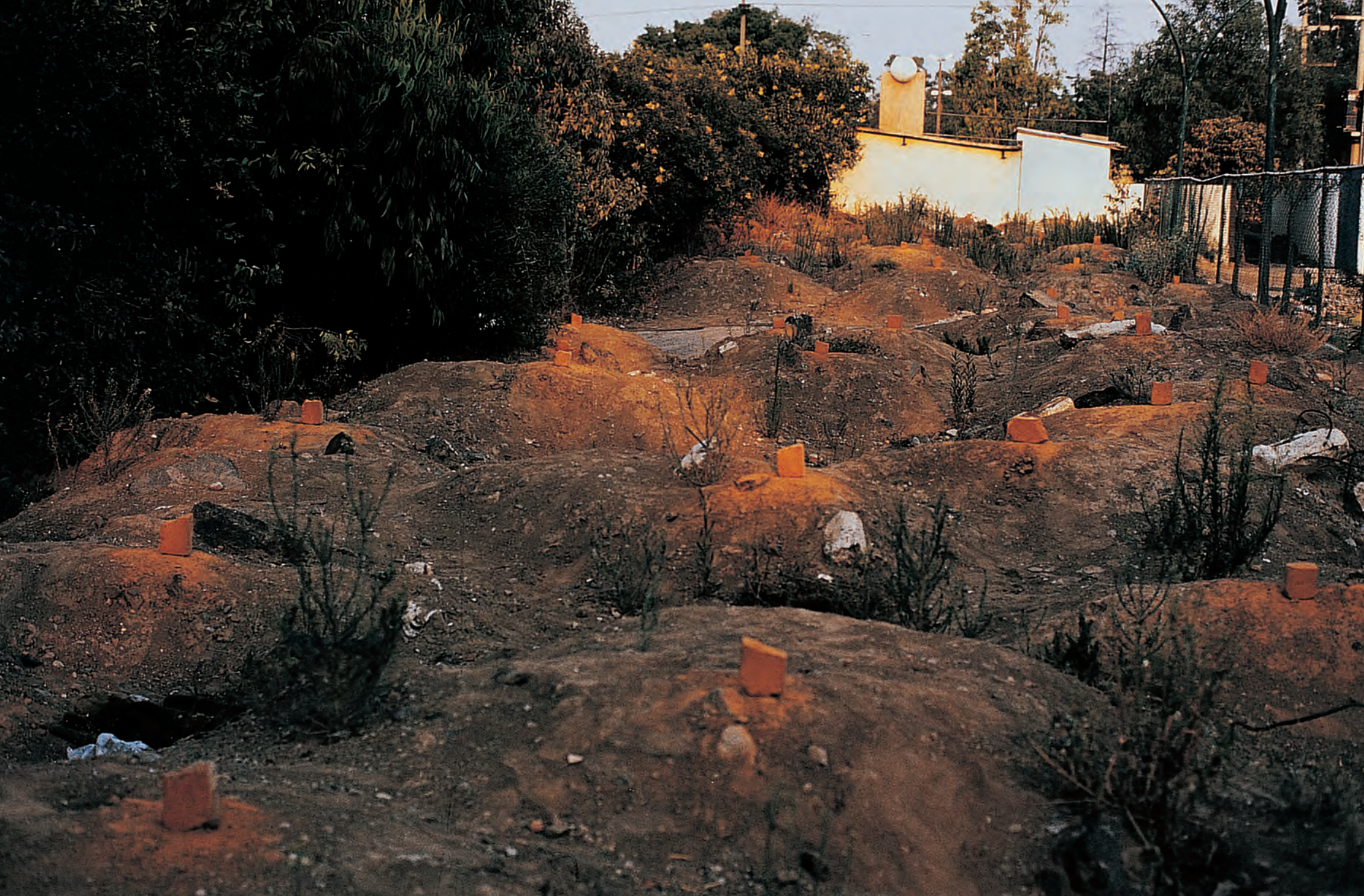
Gabriel Orozco. Ladrillos frotados , 2002 Cortesía del artista y kurimanzutto, 2002, Cd. de México Colección Telefónica